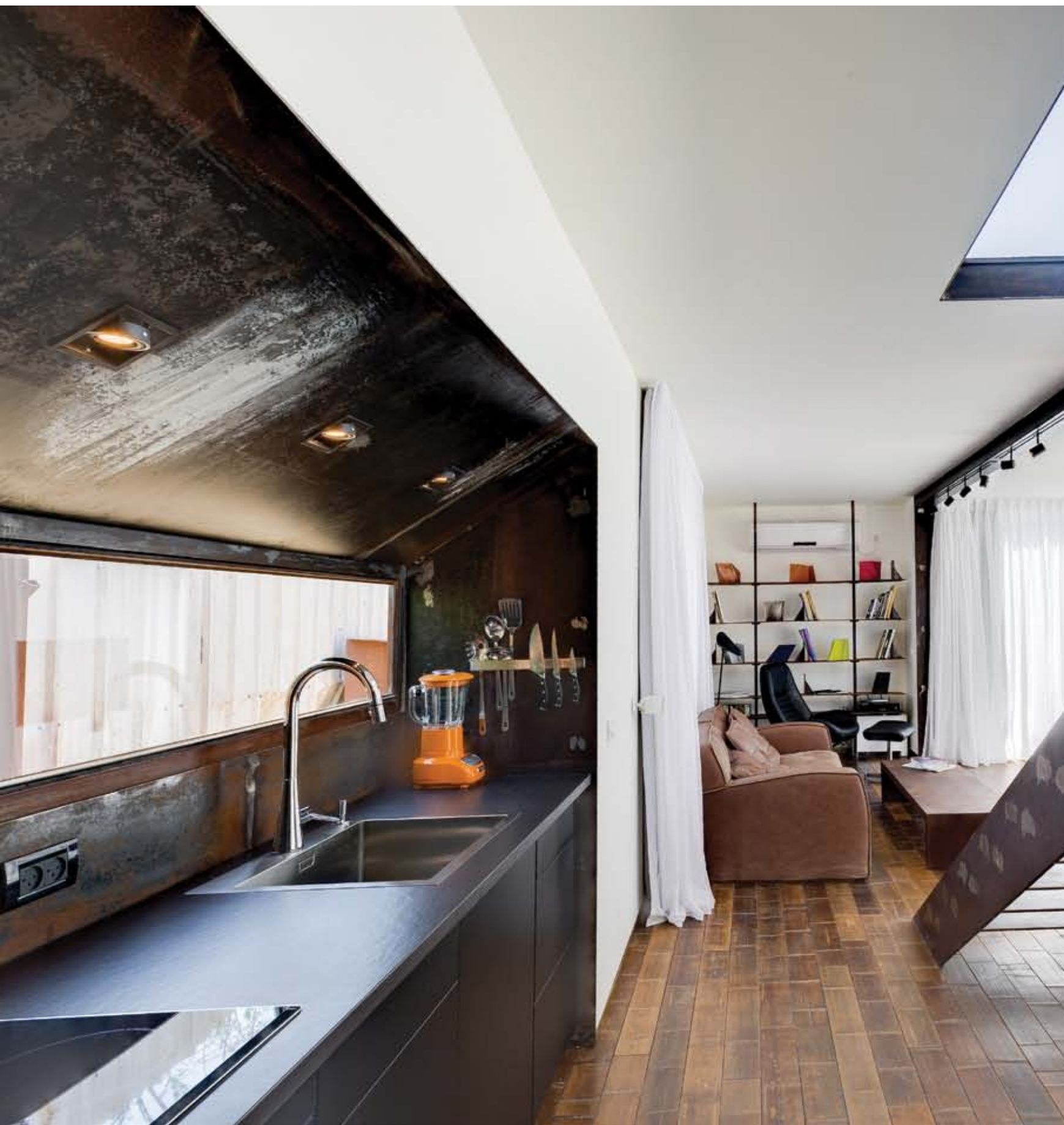
Made of exposed Corten sheets the steps and kitchen - sculptural elements giving the house its artistic touch, without paying too much attention to the practical dimension.