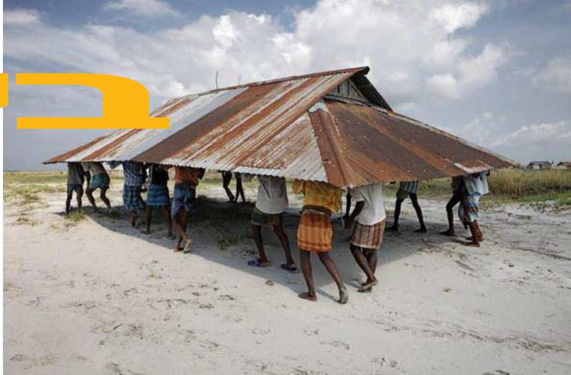
גג של מסגד בצפון בנגלדש עובר דירה