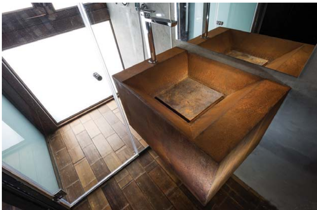
למעלה: הספרייה על פרטיה העשויים ממתכת חשופה. למטה: כיור הקורטון, שימוש בלתי מקובל בחומר. בעמוד השמאלי: חדר האמבטיה. תכנון וביצוע: אדם פרץ.